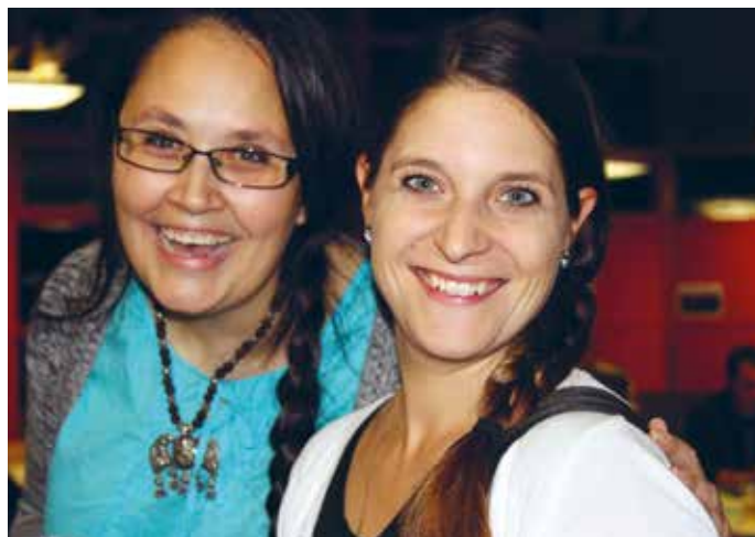
Ein toller Abend mit glücklichen Gesichtern