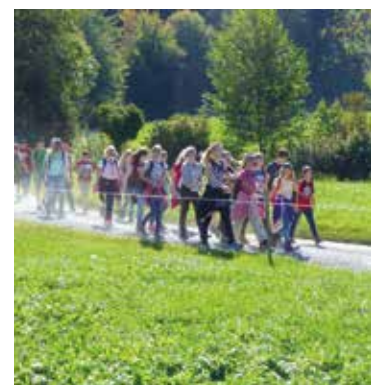
Gelungener Wandertag der Oberstufe Boswil

Im morgentlichen leichten Herbstnebel wurde dann die waldige Anhöhe des Lütlibuech erklommen, alles auf sicheren Waldwegen Richtung Ammerswil. Langsam übernahm der Sonnenschein das Wetterregime für den Tag und der Anstieg auf den Rietenberg konnte beginnen. Die Wege waren trocken, die Strecke abwechslungs-