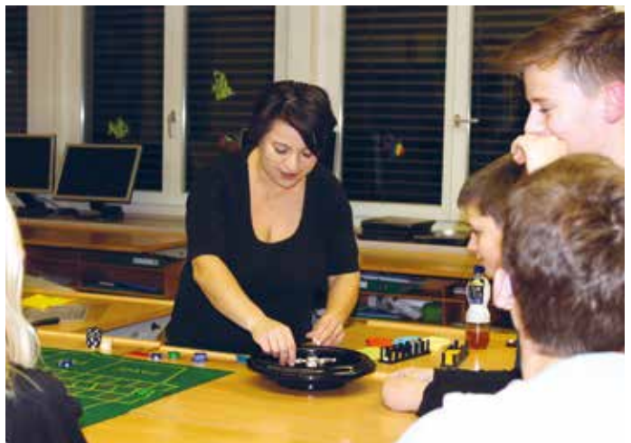
«Rien ne va plus»