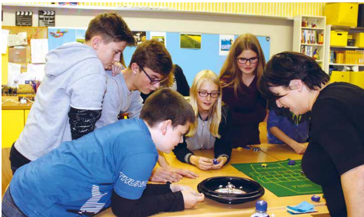
Auf welcher Zahl bleibt die Kugel im Roulette-Rad stehen?