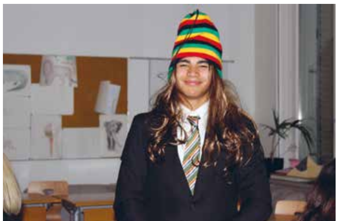
Gestylt und inkognito im Casino Boswil