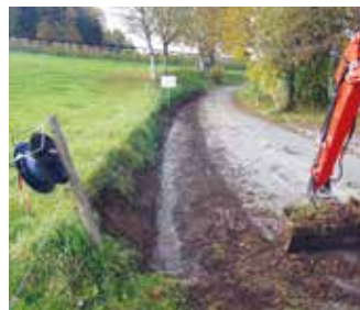
Stassenunterhalt im Weiler Wissenbach...