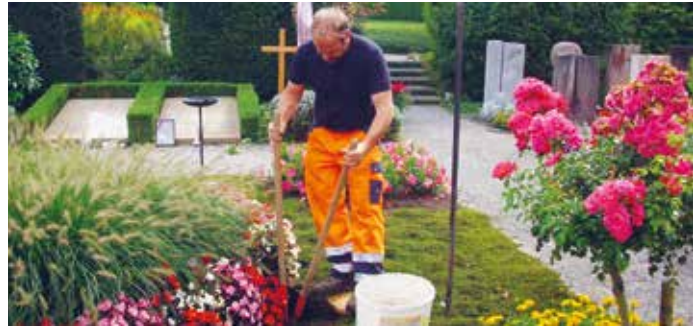
Ein Urnengrab wird ausgehoben.