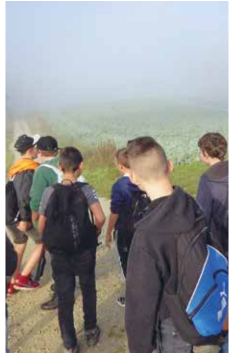
Im Nebel Richtung Ammerswil