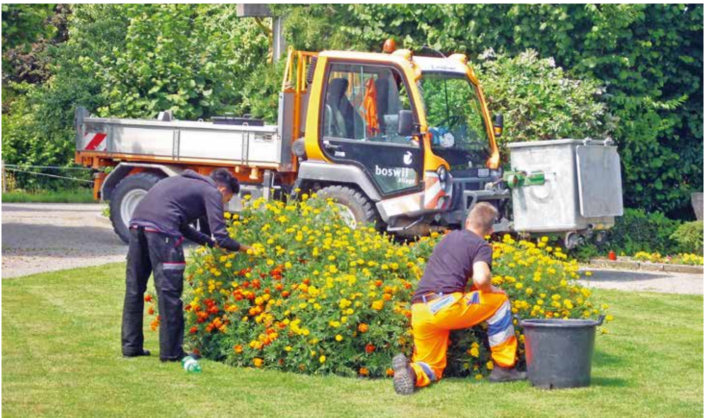
Lehrlinge in der Gartenpflege beim Friedhof...