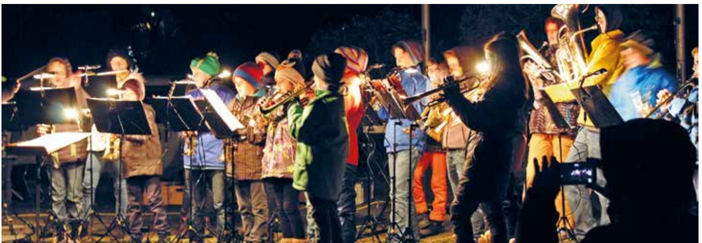
Die Mini Hoppers begrüßen die Kinder in der Arena