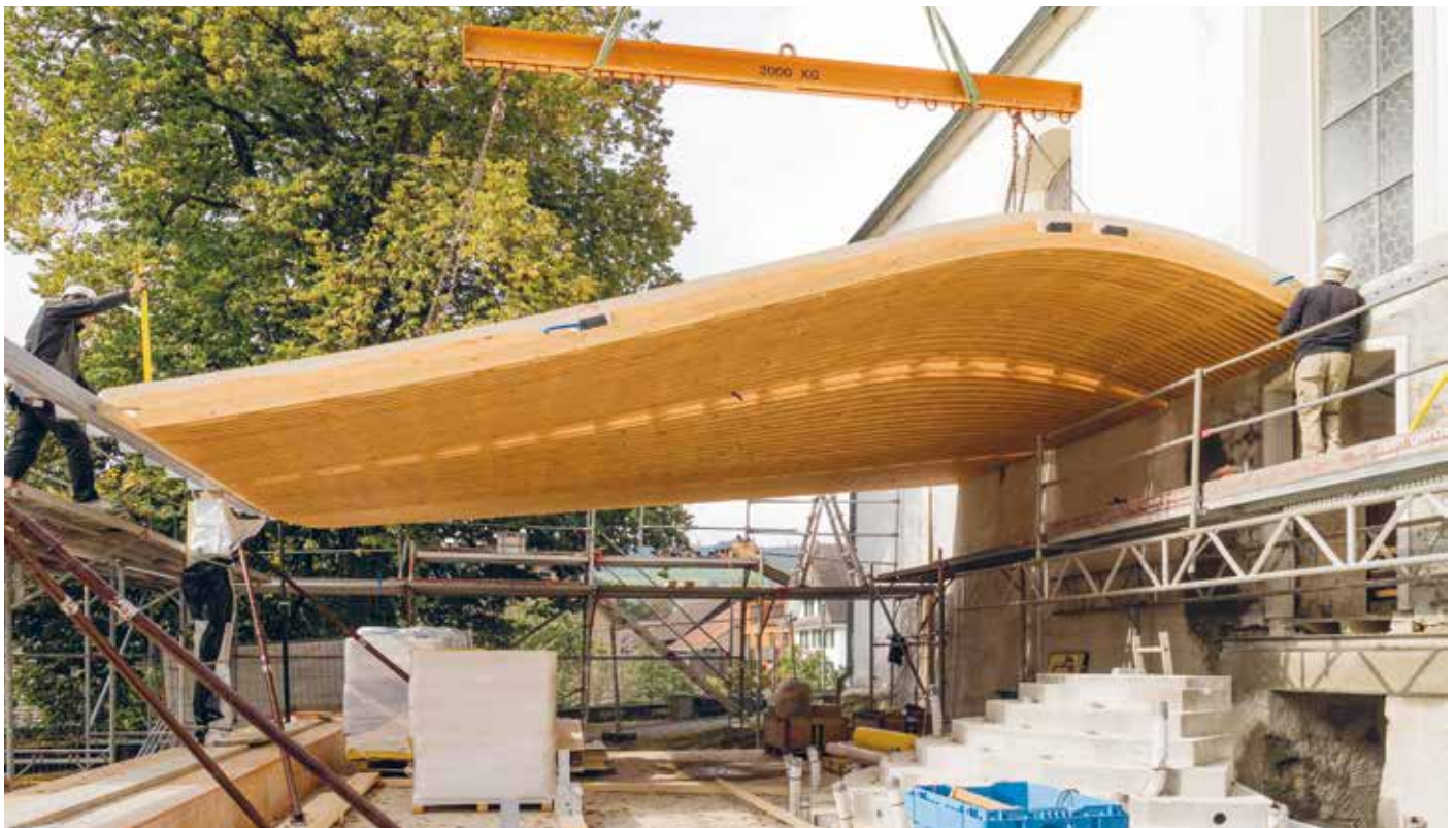
Bewilligter moderner Anbau trotz Denkmalschutz – gewölbtes Holzdach auf einer Glas-Stahl-Konstruktion

1664 wurde die Alte Kirche Boswil in der heutigen Grösse fertiggestellt, 1675 das Boswiler Sigristenhaus errichtet, 1758 das neue Pfarrhaus (das heutige Gästehaus des Künstlerhauses) beendet, 1970 das «Atelierhaus» (Werderhaus) beim Parkplatz gekauft, um Platz für die Bildende Kunst zu schaffen. Nun, 2016, folgt die Fertigstellung des neuen Foyers an die Alte Kirche, um das Künstlerhaus zeitgemäss an die aktuellen und zukünftigen Bedürfnisse anzupassen. Es ist das erste Mal, dass die Kantonale Denkmalpflege im Aargau einen Anbau an einen historischen Kirchenbau bewilligt hat, und das geschwungene, im Innern