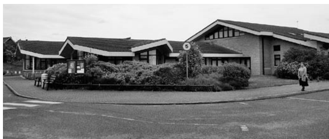
Primarschule «Palm Bay» in Cliftonville, England

In meiner halbjährigen Weiterbildung an der Fachhochschule Aargau vom letzten Frühling hatte ich die Chance, in das Englische Schulsystem hineinzuschauen und eine Primarschule zu besuchen. Ein Ziel war das Kennenlernen der Führungsstruktur einer englischen Primarschule. Es war für mich ein lehrreiches und interessantes Entdecken.