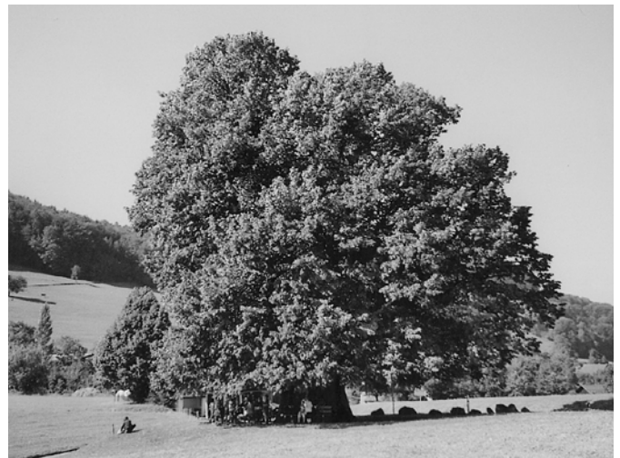
Linde von Linn

Wir gingen auf der Schulreise zur Linde von Linn. In der Nähe von Brugg steht die Linde von Linn. Wir haben gestaunt, dass die Linde so gross und so alt ist wie