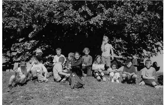
Mittagsrast bei der Linde von Linn

An der Schülerreise waren wir bei der Linde von Linn. Die Linde von Linn ist keine normale Linde, denn sie ist achthundert Jahre alt und es braucht elf Kinder, um den Stamm zu umspannen. Die Linde von Linn sieht man auf dem Wanderweg schon von weitem. Die hohlen Stellen des Stammes sind mit Gittern zugemacht. Bei der Linde von Linn hat es eine schöne Atmosphäre.