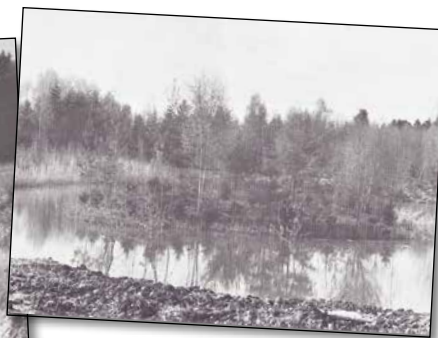
Insel im nördlichen Weiher