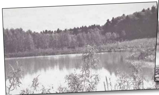
Winter 1968/69, südlicher Weiher im Feldenmoos Hintergrund: links Pappelkulturen, rechts: Hinterforst