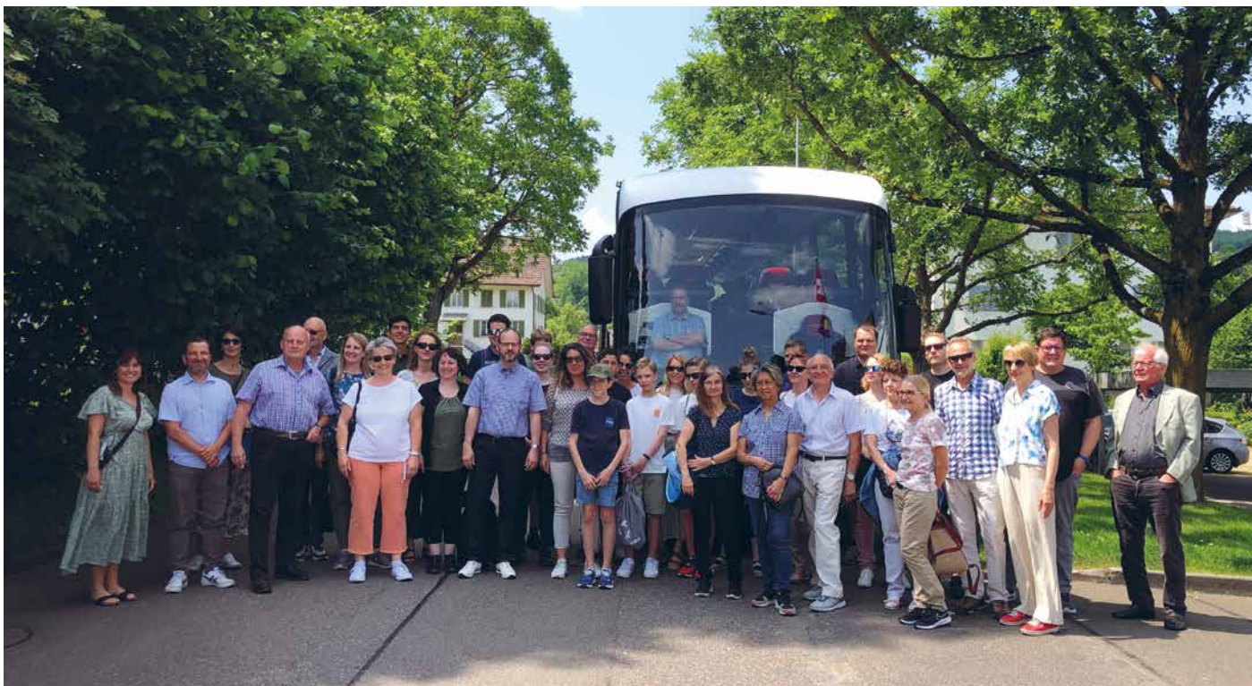
5623 – Montag, 5.6.23 – Boswiler, ab nach Bern

Anlässlich der Festansprache am 1. August 2022 in Boswil hat Nationalrat Cédric Wermuth, ehemals wohnhaft an der Bachstrasse hier in Boswil, den Gemeinderat mit einer beschränkten Delegation Einwohner/-innen nach Bern eingeladen.