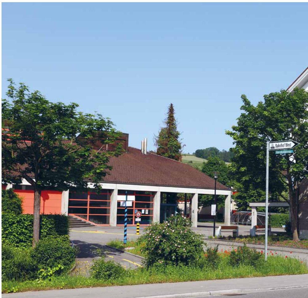
Das neue Schulgebäude soll neben der Einfahrt zur Unterführung, beim Standort der heutigen Parkplätze stehen

Um den Bedarf der Schule kurz- bis mittelfristig abdecken zu können, werden 5 Klassenzimmer, mehrere Gruppenräume und ein grösseres Lehrerzimmer mit Vorbereitungsraum benötigt. Mit dem Wettbewerb sucht die Gemeinde ein qualitativ hochstehendes Projekt für den geplanten Erweiterungsbau sowie einen geeigneten Partner für dessen Realisierung. Unterstützt und begleitet wird die Gemeinde dabei von der Firma PLANAR AG für Raumentwicklung, Zürich, sowie einer breit abgestützten Jury. Die Jury setzt sich zusammen aus Vertretern des Gemeinderates und der Schule sowie externen Fachleuten aus den Bereichen Architektur, Landschaftsarchitektur, Ortsbildschutz und Bauökonomie. Das Verfahren wird als anonymer Projektwettbewerb mit Präqualifikation durchgeführt, d.h. während der Projekterarbeitung finden keine Kontakte zwischen der Jury und den teilnehmenden Planungsteams statt. Dadurch ist sichergestellt, dass bei der Beurteilung der Projekte deren Qualität im Vordergrund steht. Das Verfahren wird öffentlich ausgeschrieben, d.h. alle interessierten Planungsbüros können sich für eine Teilnahme am Verfahren bewerben. Die Jury wählt aus den