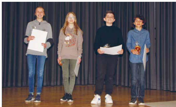
Die strahlenden Gitarrist*innen