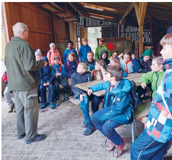
Faszinierte Blicke bei den Erläuterungen zur Jagdausrüstung