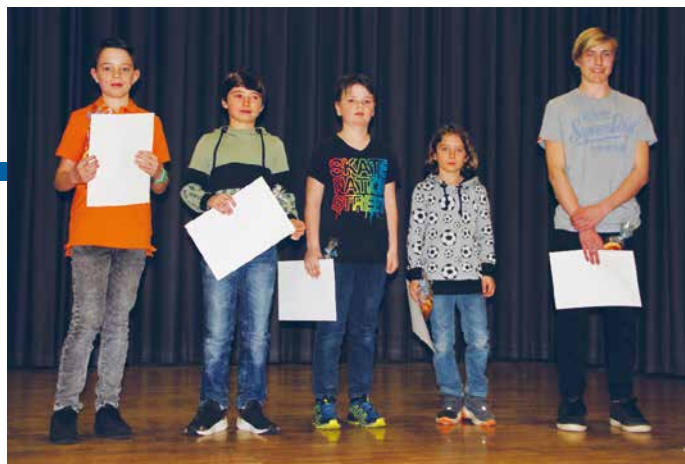
Die Schlagzeuger mit ihrem verdienten mCheck-Zertifikat